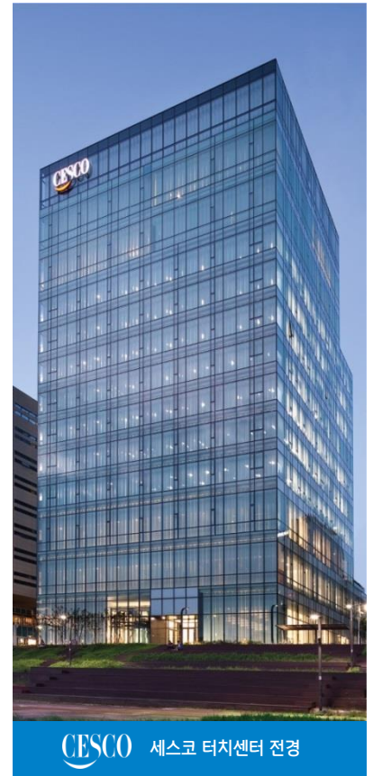
세스코 터치센터 전경